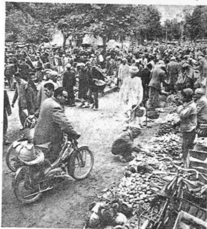
Boufarik traditionnelle... Toujours aussi grouillante, le marché du lundi

La culture traditionnelle et industrie naissante font bon ménage mais posent de cruels problèmes d'habitat