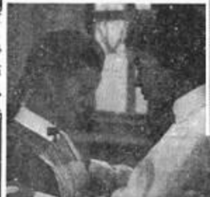
Romy SCHNEIDER et Lili PALMER

JEUNES FILLES EN UNIFORME SAFES - KENT - VARIETES - MONDIAL