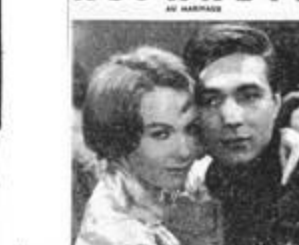
AU STUDIO ALLETTI