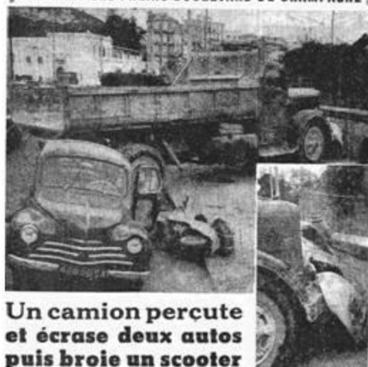
Un camion percute et écrase deux autos puis broie un scooter

ROMPANT SES FREINS BOULEVARD DE CHAMPAGNE