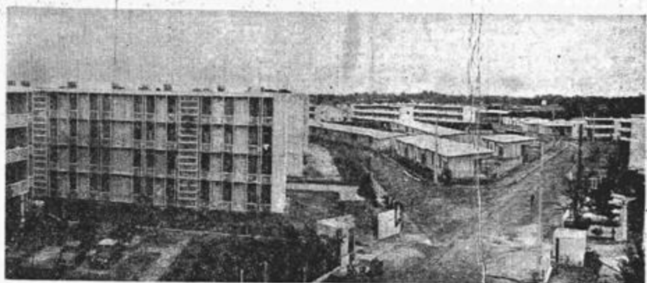
Bâtiments préfabriqués et en béton : nouvelles cités

Le guide du centenaire de « l'Algérie de papa » indiquait Boufa-